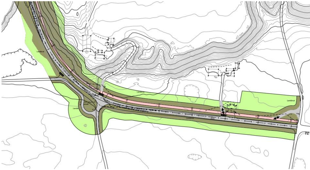
Figur 1 Kartutsnitt av gjeldende plankart fra 2013

I plankart fra 2013 ble flere avkjørsler regulert bort i plankartet, og samlet i felles avkjørsler. Kjøring til eiendommene ved Hoem skulle samles i én avkjørsel ved gårdsveg til Hoemsvegen 30.